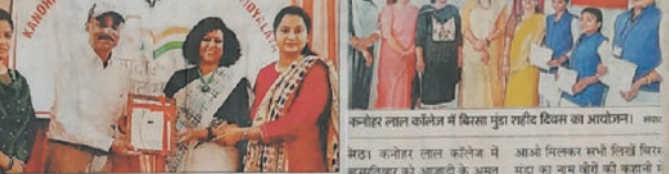
कनोहर लाल कॉलेज में प्रतिष्ठित कार्यक्रमों में हुआ साझा मंच