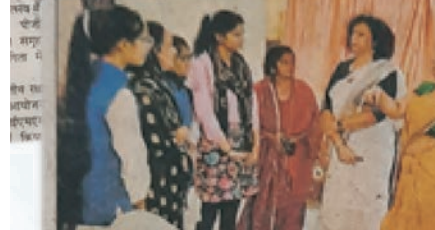
कनोहर लाल कॉलेज में प्रतिष्ठित कार्यक्रमों में हुआ साझा मंच

शैक्षणिक संस्थानों में मनाया 'शहीद बिरसा मुंडा के व्यक्तित्व से ले प्रेरणा'