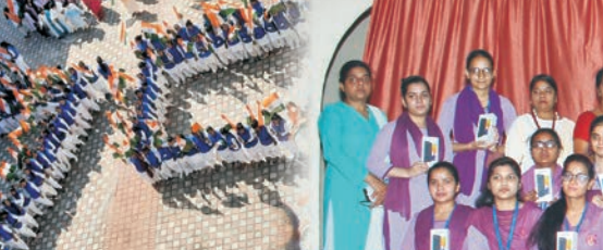
कनोहर लाल कॉलेज में प्रतिष्ठित कार्यक्रमों में हुआ साझा मंच

शैक्षणिक संस्थानों में मनाया 'शहीद बिरसा मुंडा के व्यक्तित्व से ले प्रेरणा'