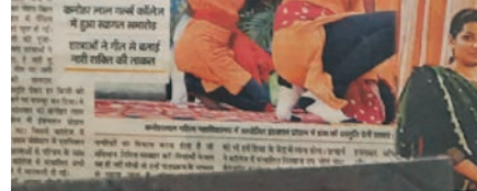
कनोहर लाल कॉलेज में प्रतिष्ठित कार्यक्रमों में हुआ साझा मंच