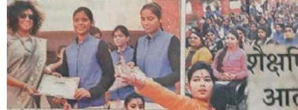
कनोहर लाल कॉलेज में प्रतिष्ठित कार्यक्रमों में हुआ साझा मंच

शैक्षणिक संस्थानों में मनाया 'शहीद बिरसा मुंडा के व्यक्तित्व से ले प्रेरणा'