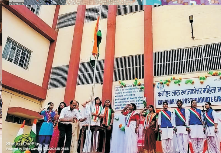
कनोहर लाल कॉलेज में प्रतिष्ठित कार्यक्रमों में हुआ साझा मंच