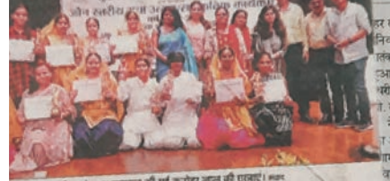
कनोहर लाल कॉलेज में प्रतिष्ठित कार्यक्रमों में हुआ साझा मंच