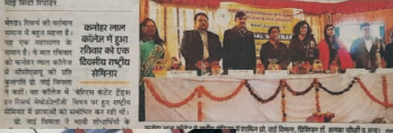
कनोहर लाल कॉलेज में हुआ शैक्षणिक कार्यक्रम