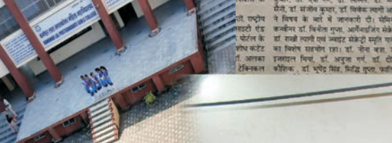
कनोहर लाल कॉलेज में प्रतिष्ठित कार्यक्रमों में हुआ साझा मंच

शैक्षणिक संस्थानों में मनाया 'शहीद बिरसा मुंडा के व्यक्तित्व से ले प्रेरणा'