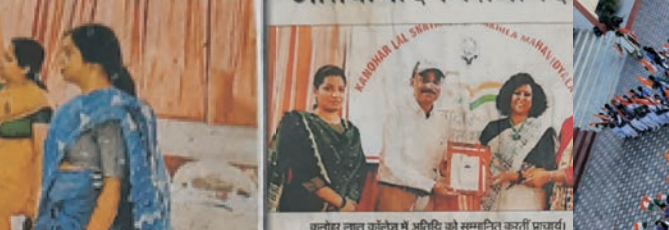
कनोहर लाल कॉलेज में प्रतिष्ठित कार्यक्रमों में हुआ साझा मंच

शैक्षणिक संस्थानों में मनाया 'शहीद बिरसा मुंडा के व्यक्तित्व से ले प्रेरणा'