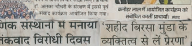
कनोहर लाल कॉलेज में बिरसा मुंडा शहीद दिवस का आयोजन।

शैक्षणिक संस्थानों में मनाया 'शहीद बिरसा मुंडा के व्यक्तित्व से ले प्रेरणा'